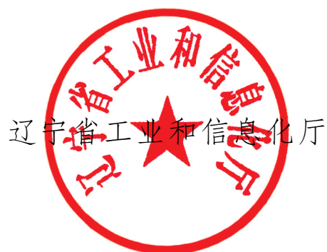
辽宁省工业和信息化厅