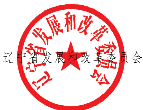
辽宁省发展和改革委员会