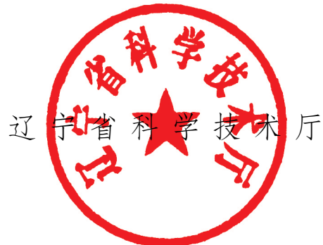
辽宁省科学技术厅